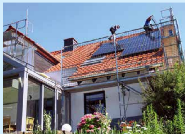
Der Sommer 2018 war super – aber auch in Zukunft kann sich die Anschaffung einer PV-Anlage noch lohnen.

Sonnenernte: 2018 war ein Super-Sommer für Solar-Besitzer, auch in Wipperfürth gibt es noch ungenutztes Potenzial