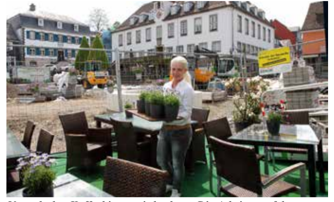
Vorne lecker Kaffee, hinten wird gebaut: Die Arbeiten auf dem Marktplatz sollen sich gar nicht oder nur wenig verzögern.

Das Pflaster auf der Wipperfürther Marktplatz bekommt einen neuen Unterbau – zu zeitlichen Verzögerungen soll es aber trotzdem nicht oder nur kaum kommen. Anfang April war bei Tests während der Umbauarbeiten auf dem Marktplatz aufgefallen, dass der bisherige Untergrund den aktuellen Ansprüchen nicht mehr genügt. „Das bei den Rückbauarbeiten vorgefundene Material entsprach nicht den heutigen Standards in Bezug auf die Tragfähigkeit und musste daher entfernt werden“, teilte die Stadt damals mit. Um zu verhindern, dass sich der neue Bodenbelag teilweise absinkt, was auch die angestrebte Barrierefreiheit des Platzes eingeschränkt hatte, musste eine Lösung her. Nach sogenannten Lastplattendruckversuchen entschied sich die Stadt dazu, den Untergrund für die Pflasterfläche auf dem Marktplatz weitestgehend neu aufzubauen: „Das gewählte Material ist geeignet, um einen ausreichend stabilen Unterbau für die Pflasterfläche auf dem Marktplatz herzustellen“, sagt die Ver-