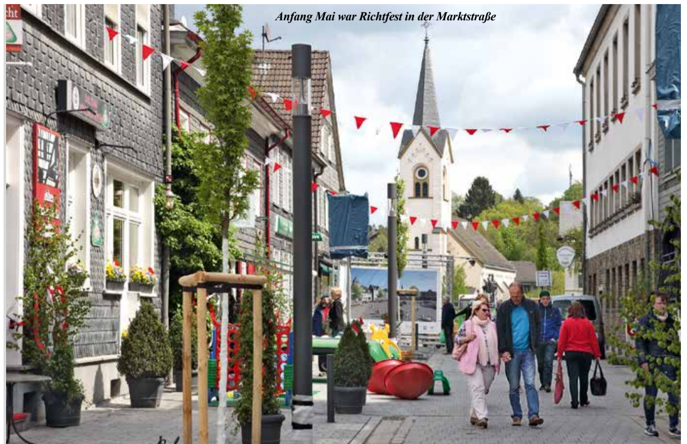
Anfang Mai war Richtfest in der Marktstraße