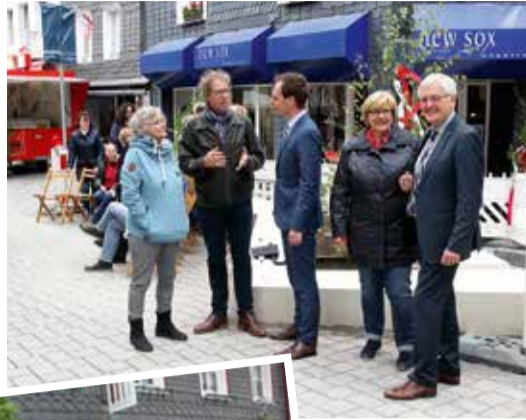
„Schwätzchen“ mit Bürgermeister und Regionaldirektor.

Es gab eine Kleinigkeit zu trinken, Spiele und Schminken für die Kinder – und jede Menge Grund zur Freude: Anfang Mai wurde in der Marktstraße „Richtfest“ gefeiert. Auch wenn noch ein paar letzte Kleinigkeiten zu erledigen waren, wurde sie als eine der wichtigsten Geschäftsstraßen in Wipperfürth quasi wiedereröffnet. Und weil sie so schön mit Wimpeln und Maibäumen geschmückt war, fiel das Flatterband auch gar nicht auf.